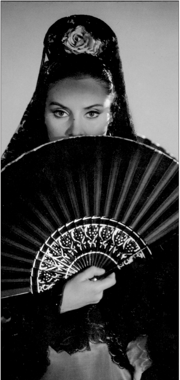
Laura del Sol als Carmen im Film von Carlos Saura